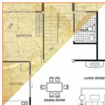
Verbessern Sie Ihre Originale