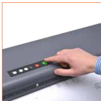
Flexibles Bedienfeld für einfache Bedienung

Scannen und dokumentieren Sie Ihre gesamten technischen Zeichnungen, ■