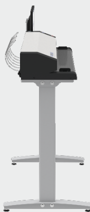
Erforderliche Tiefe weniger als 65cm